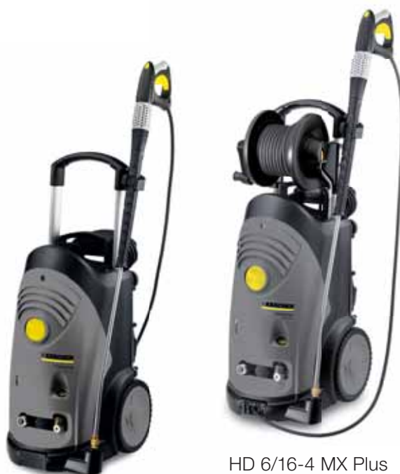
HD 6/16-4 MX Plus